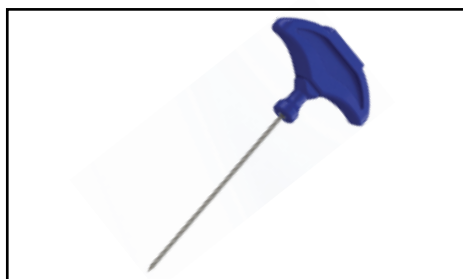
Ponteira de Aço