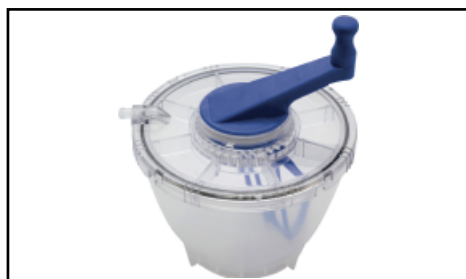
Misturador de Cimento

O paciente é beneficiado com esta cirurgia, pois a mesma diminui as suas dores e o conduz a uma melhora em sua mobilidade e a volta as suas atividades, prejudicadas pela lesão.